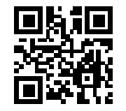
Ersatzhaltestelle Ri. Höllriegelskreuth