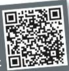
Ihr QR-Code zum persönlichen Fahrplan

Weitere Infos erhalten Sie unter 089 20 35 5-000 (Ortstarif) und unter www.s-bahn-muenchen.de/baustellen Oder melden Sie sich für den kostenlosen E-Mail-Newsletter an: www.s-bahn-muenchen.de/streckenagent