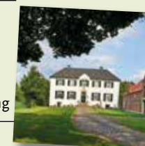
Haus Lohn, Südlohn