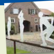
Glasmuseum, Lette