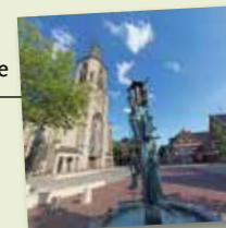
Stadtlohn Brunnen