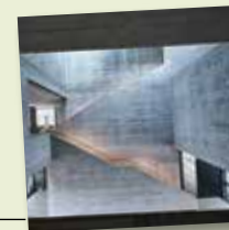
„kult“ Vreden

Weitere Ausflugstipps, Vorschläge für Rad- und Wandertouren sowie Picknick-Tipps finden Sie auf muensterland.de und muensterland.com .