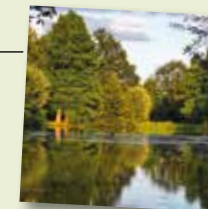
Berkelsee, Gescher