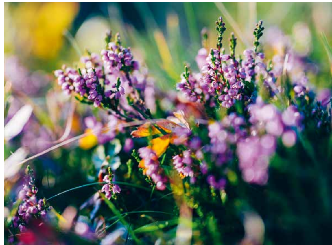
HEIDEKRAUT IN DEN ALLGÄUER HOCHALPEN