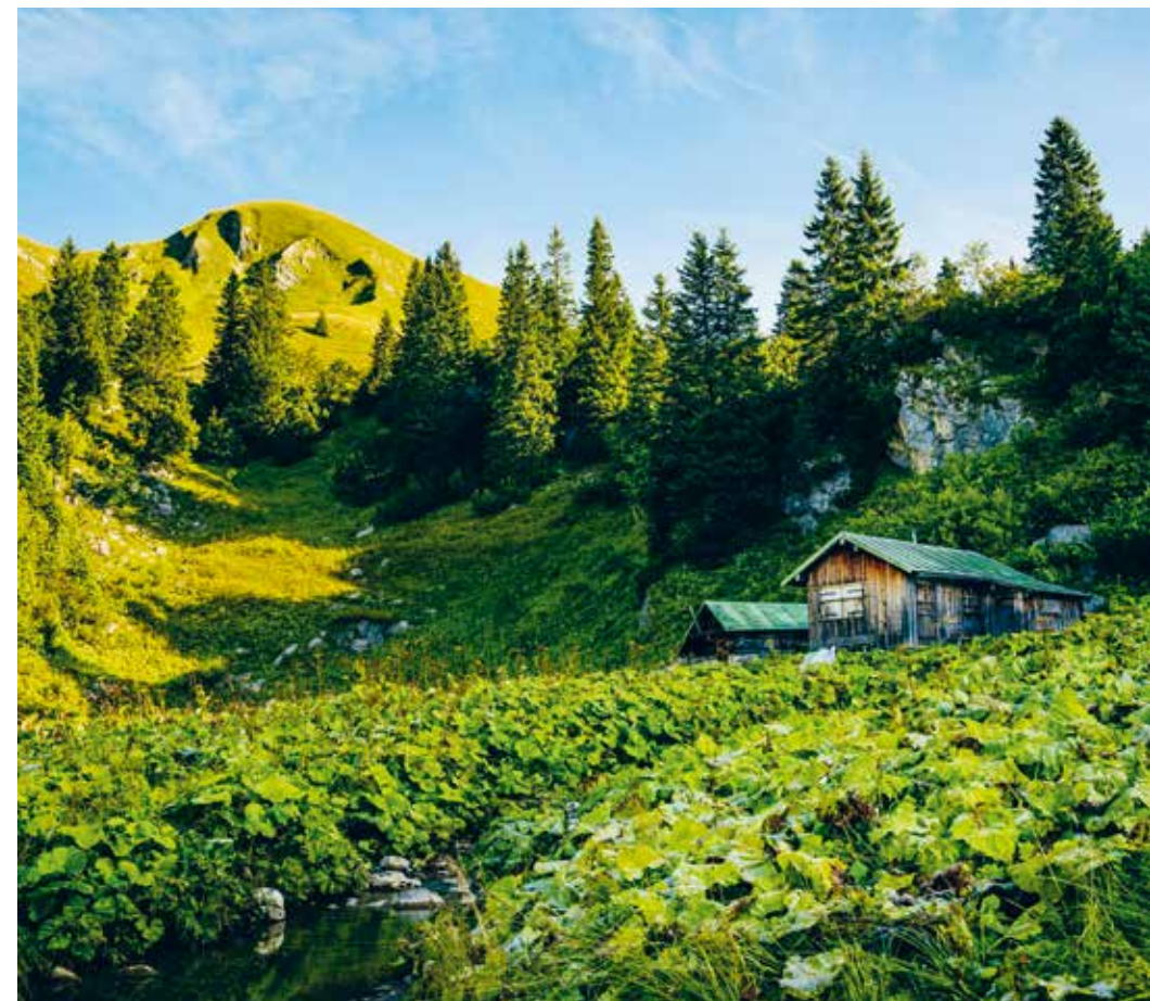
GRÜNES IDYLL IN DEN ALLGÄUER HOCHALPEN

Hat Henning Werth noch einen Tipp für eilige Besucher? „Die ganze Schönheit der Allgäuer Hochalpen erschließt sich Besuchern, wenn sie mit dem Bus ins Hintersteiner Tal zum Giebelhaus fahren und dort unsere Adlerhütte besichtigen. Anschließend sollten sie ins Obertal durch einen fantastischen Bergwald laufen, bevor sie im Engeratsgund von den Pfiffen der Murmeltiere begrüßt werden. Zum Abschluss sollten sie sich auf der bewirtschafteten Alpe Laufbichl mit leckeren regionalen Spezialitäten verwöhnen lassen.“ Machen wir!