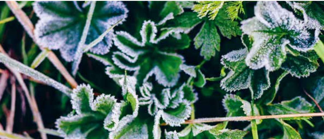
ERSTER BODENFROST IM SEPTEMBER