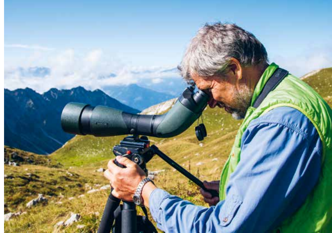
DEN STEINADLER IM BLICK