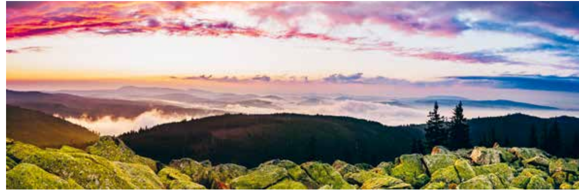
NATIONALPARK BAYERISCHER WALD

Fahrtziel Natur – das sind herausragende Schutzgebiete zwischen der Nordsee und den Alpen. Das sind nicht zuletzt aber auch die Menschen, die sich auf ihre ganz spezifische Art vor Ort dafür einsetzen, vielfältige Lebensräume zu bewahren. Wie etwa der Fotograf, der die oft verborgenen Geheimnisse des Frankenwaldes mit seiner Kamera festhält. Oder die ehemalige Krankenschwester, die heute im Biosphärenreservat Bliesgau erfolgreich ein veganes Bistro mit regionalen Lebensmitteln führt.