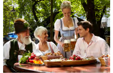
A Kupka © München Tourismus

Ob Brezn, Braten oder Sushi, Pasta, Wein, Bier oder Champagner, Biergarten, Gasthaus, Trattoria oder Gourmettempel hier findet jeder das Richtige für seinen Geschmack.