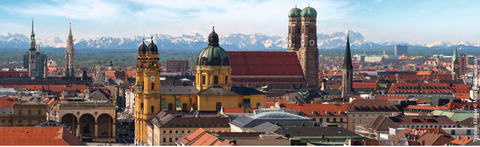
Thomas Klügel © München Tourismus