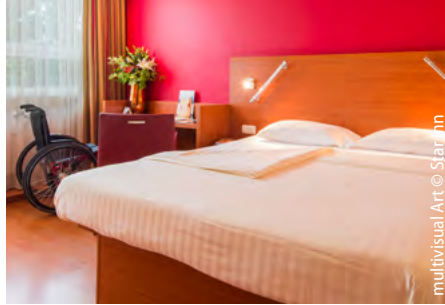
multivisual Art © Star Inn

Je nach Vorliebe, Geldbeutel oder Mobilitätseinschränkung von der Jugendherberge bis zum 5-Sterne-Hotel. Hier schlafen Sie gut nach spannendem und genussvollem Tag.