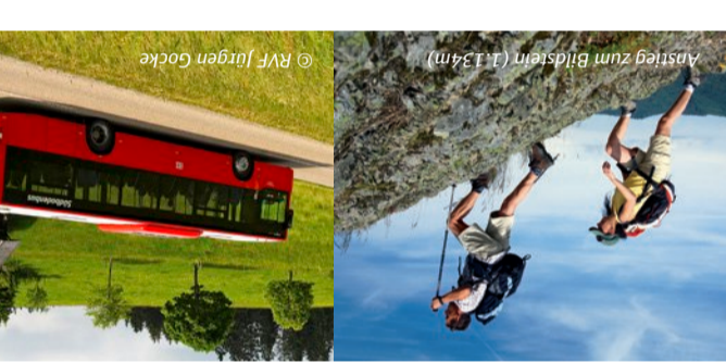
In der Hohwehrschlucht, Schluchsee Unterkrummenhof