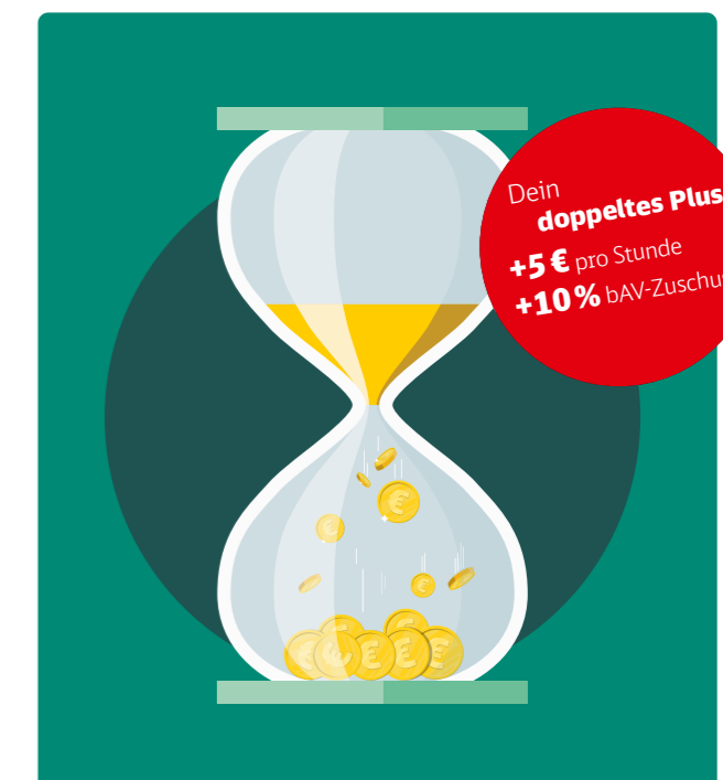
Das Rentenplus-Modell der DB

i Mehr über das Angebot unter db.de/rentenplus