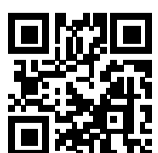
Ersatzhaltestelle Richtung Lübeck

Von Gleis 2: Verlassen Sie den Bahnsteig und begeben Sie sich an die Bahnhofstraße. Halten Sie sich links. Die Ersatzhaltestelle in Richtung Lübeck Hbf befindet sich in unmittelbarer Nähe zu Bahnhofsgebäude. Die Ersatzhaltestelle in Richtung Kiel befindet sich auf der gegenüberliegenden Straßenseite.