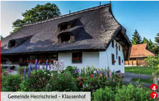
Gemeinde Herrschried – Klausenhof