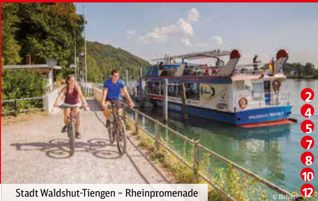
Stadt Waldshut-Tiengen – Rheinpromenade