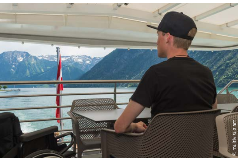
An Deck der MS Innsbruck