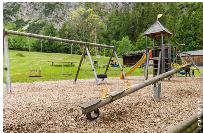
Der weitläufige Spielplatz bei der Gaisalm