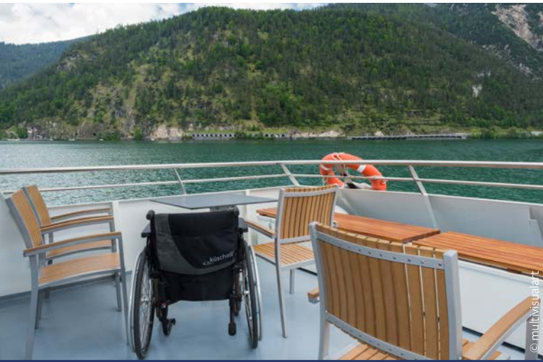
Stühle mit Armlehnen an Deck der MS Tirol