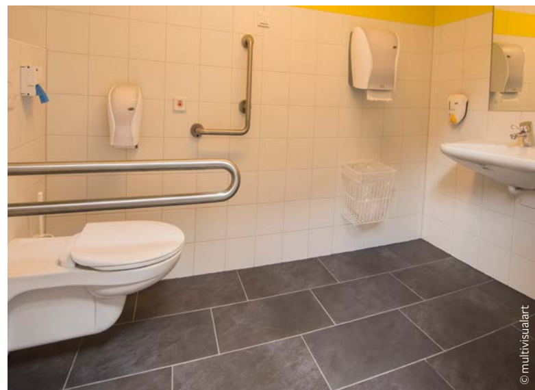
Auch die Gaisalm verfügt über ein barrierefreies WC