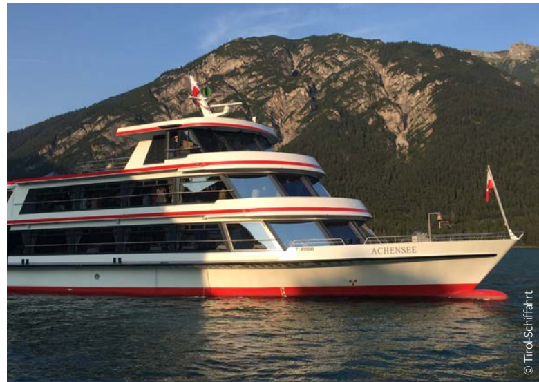
MS Achensee - ideal für Veranstaltungen