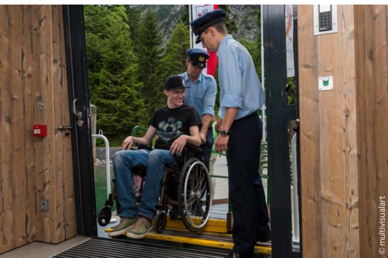
Zugang zur MS Tirol