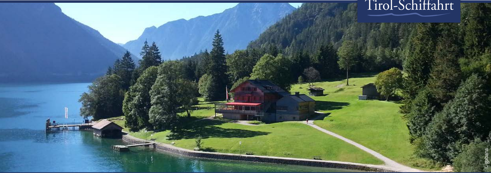
Malerisch gelegen: das Ausflugsziel Gaisalm nahe der Anlegestelle.