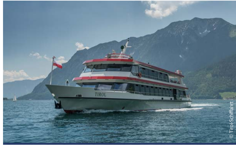
Ahoi auf der MS Tirol

Dieses Dokument ist gemäß PDF/UA-Standard visuell und technisch barrierefrei und kann von Screenreadern gelesen werden. Diese Informationen können Sie auch an Bord der MS Tirol kostenlos herunterladen.