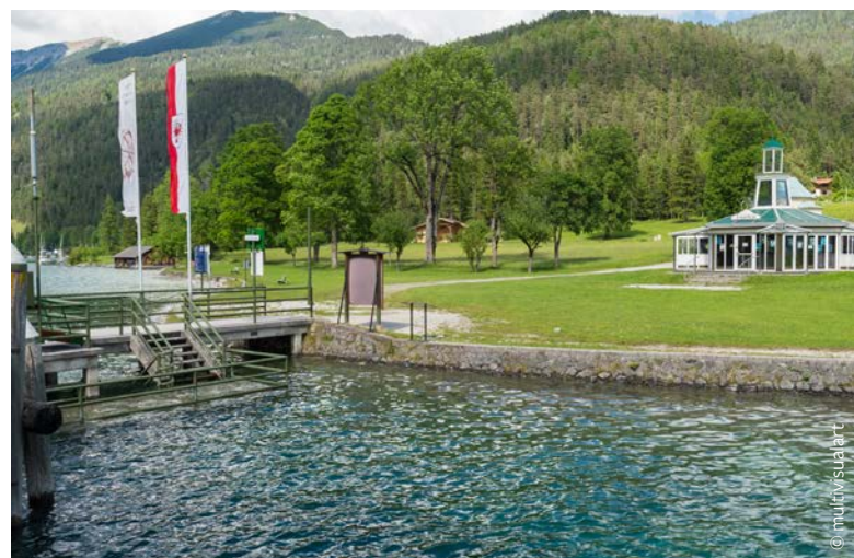
Anlegestelle Achensee / Leuchtturm