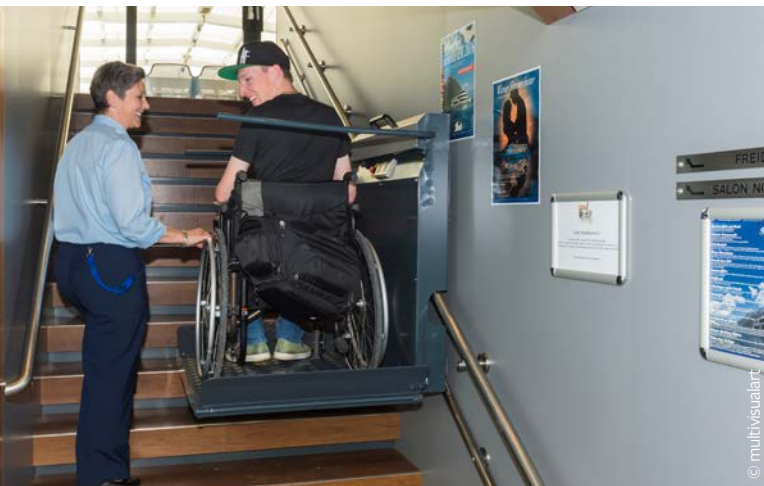
Mit dem Plattformlift geht's auf's Oberdeck