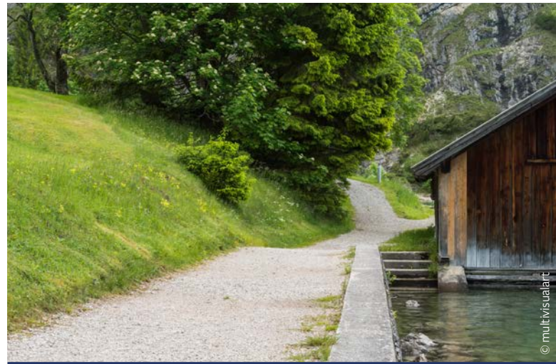
Befestigte Wege zur Gaisalm