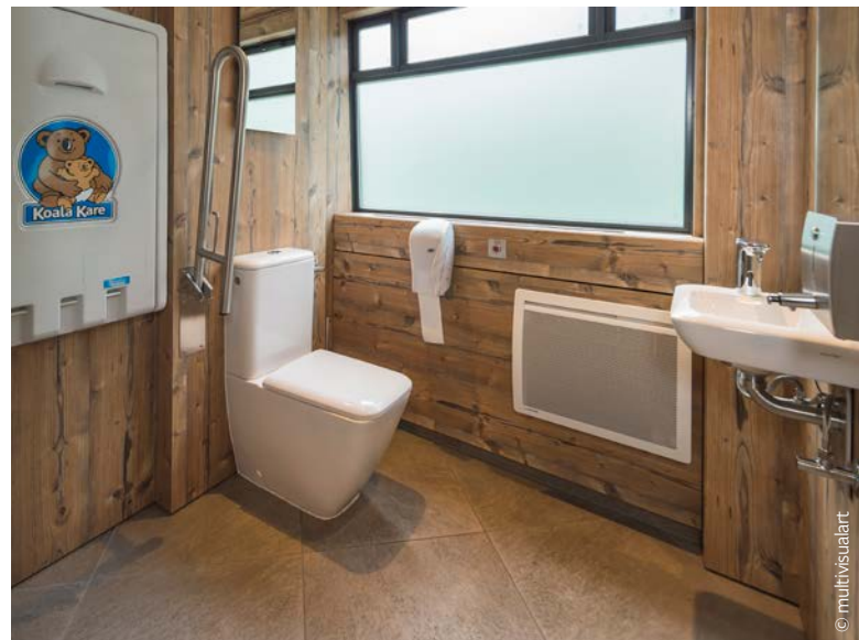
Alle Schiffe verfügen über barrierefreie Toiletten