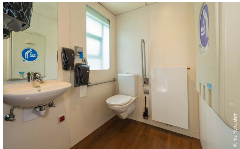
WC mit Winkel- und Stützklappgriff