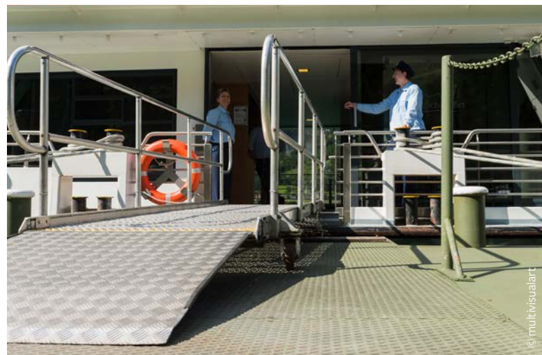
Landebrücke der MS Stadt Innsbruck