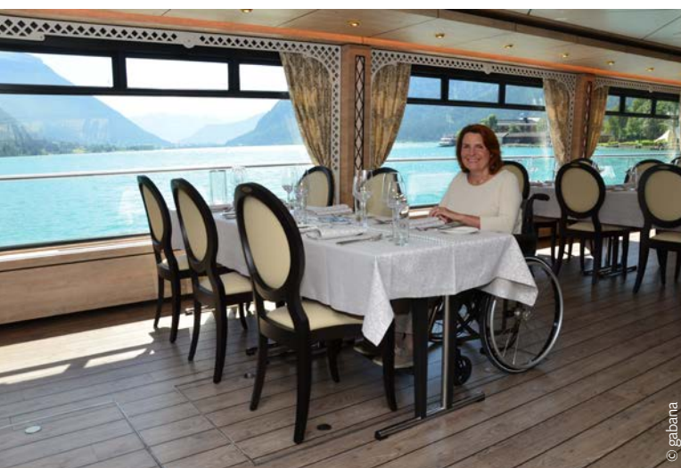
Was für ein Ausblick aus dem Salon der MS Achensee