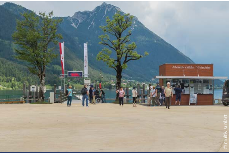
Vorplatz des Landestegs in Pertisau