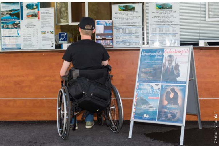
Kassenzugang in Pertisau