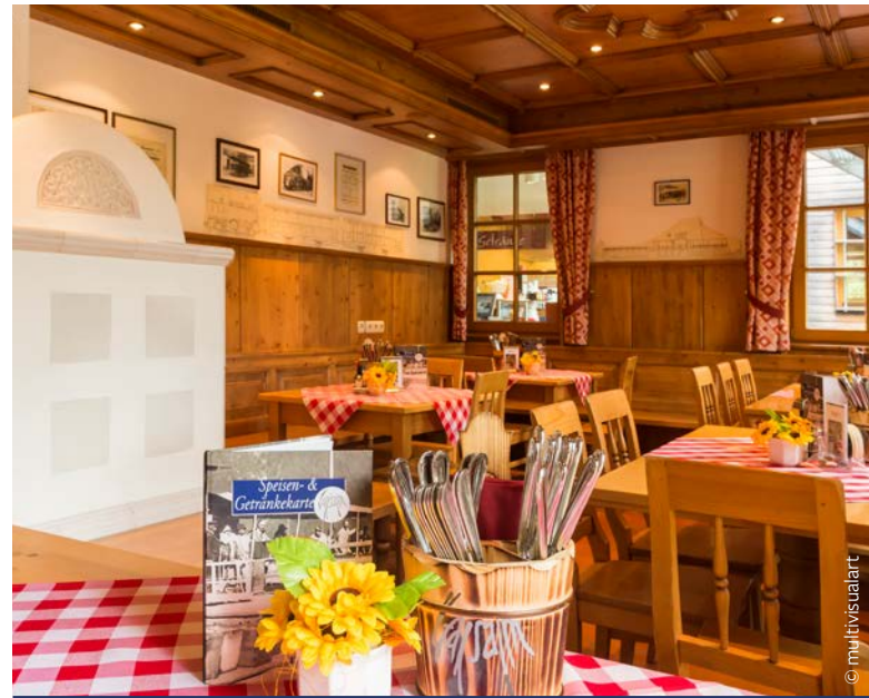
Gemütliche Einkehr in der urigen Tiroler Stube