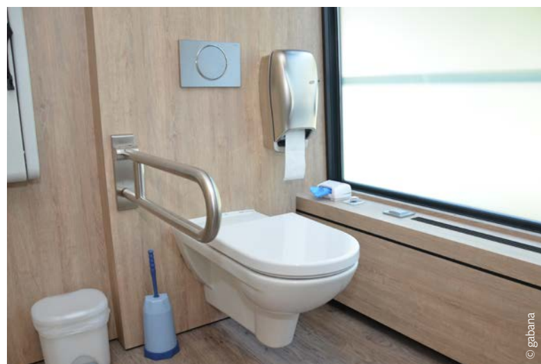
Das WC ist großzügig dimensioniert