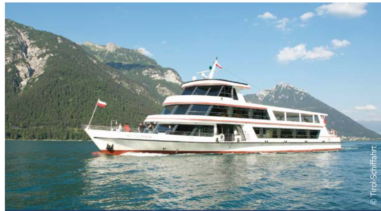
Die MS Stadt Innsbruck auf großer Fahrt