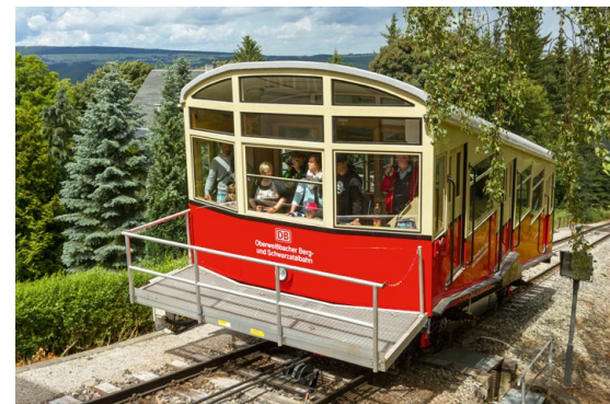
Oben rechts: Nutzer des Coffee-to-go-Bechers aus Bambus tun etwas für die Umwelt und können Geld sparen; Bild u. l.: Das Web-Video „Rollin“ macht das Bahnfahren in Bayern populär – über 900 Millionen Klicks bestätigen das; Bild u. r.: Die OBS-Kampagne „Gipfelstürmen leicht gemacht“ erhielt einen Preis als „Leuchtturm der Tourismuswirtschaft“.