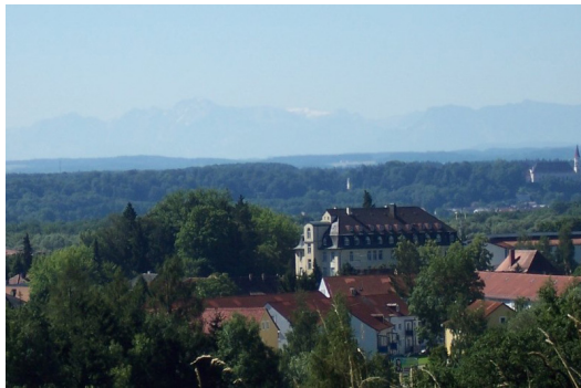
Blick ins Inntal bei Simbach am Inn

Von Simbach am Inn am Kapellenweg auf den Schellenberg (10,6 km)