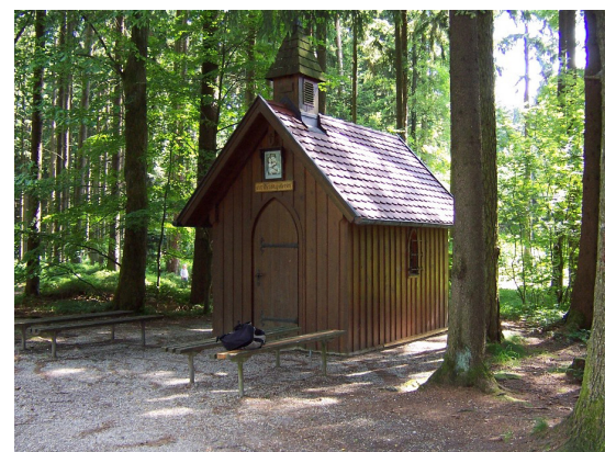
Waldkapelle am Schellenberg

weiter überqueren wir die Passauerstraße und folgen dann der Linden- und in der Weiterführung der Gollinger Straße zum städtischen Freibad. Am Parkplatz am Freibad befindet sich eine Infotafel zum Wanderwegenetz. In westlicher Richtung geht es nun weiter Richtung Schulzentrum, jedoch schwenkt unsere Tour schon nach wenigen Metern nach Norden in einen Wiesenweg, der zum Waldrand führt. Vorbei am Denkmal der Vertriebenen geht es anschließend auf einem schmalen Pfad, durch schattigen Laubwald, hinauf zur sog. Marienhöhe. Hier wurde nur wenige Meter vom Weg entfernt, eine Schutzhütte vom Wander- und Verschönerungsverein errichtet.